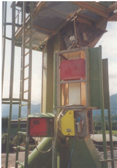
QUICKTRON 05 A fémszennyezettség szeparátor faaprítéknak szabadon esésben történő vizsgálatához

A sikeres fémszennyezettség kiválasztást követően a csappantyú automatikusan visszatér normál helyzetébe.